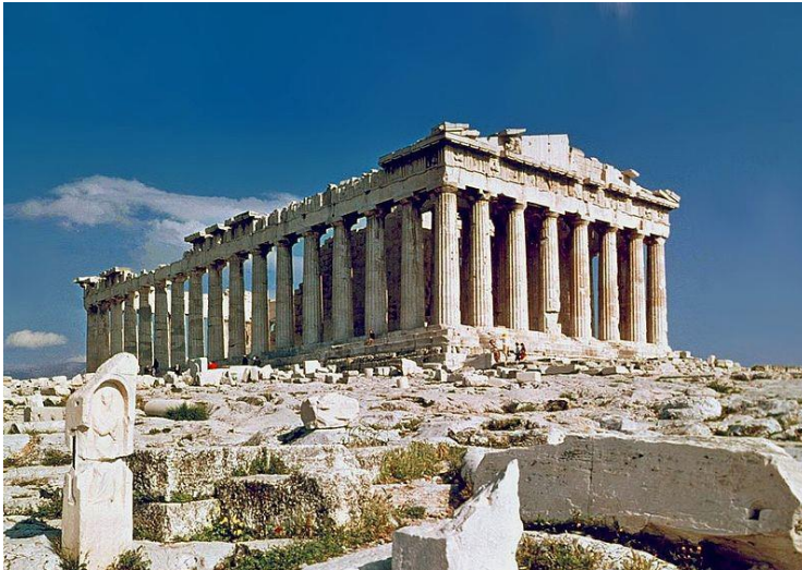
Rajah 2 / Figure 2