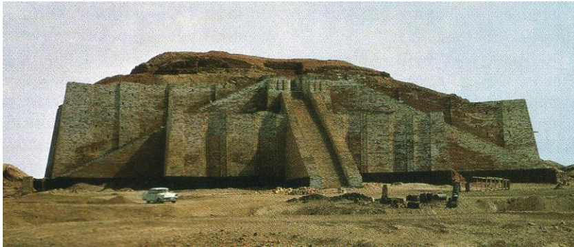
Rajah 1 / Figure 1